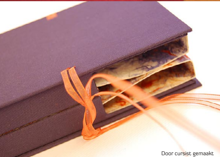
Door cursist gemaakt

Een boek is een verteld verhaal in beeld en/of taal. Geef je eigen vorm aan dit verhaal en treed buiten de grenzen van het gebonden stapeltje papier. In de werkplaats ga je op zoek naar het boek als kunstvorm. Je werkt vanuit een thema of een bestaand boek naar een kunstvorm rondom het boek. Een boek is een bron van inspiratie. Het boek kan dienen als medium. In de werkplaats verken je de grenzen van een boek... een boek wordt een schilderij, een schilderij wordt een boek. Je gaat op zoek naar de eindeloze mogelijkheden van het kunstenaarsboek. Alle technieken komen aan bod. Eeuwenoude boekbinderstechnieken, maar ook nieuwe digitale bewerkingen.