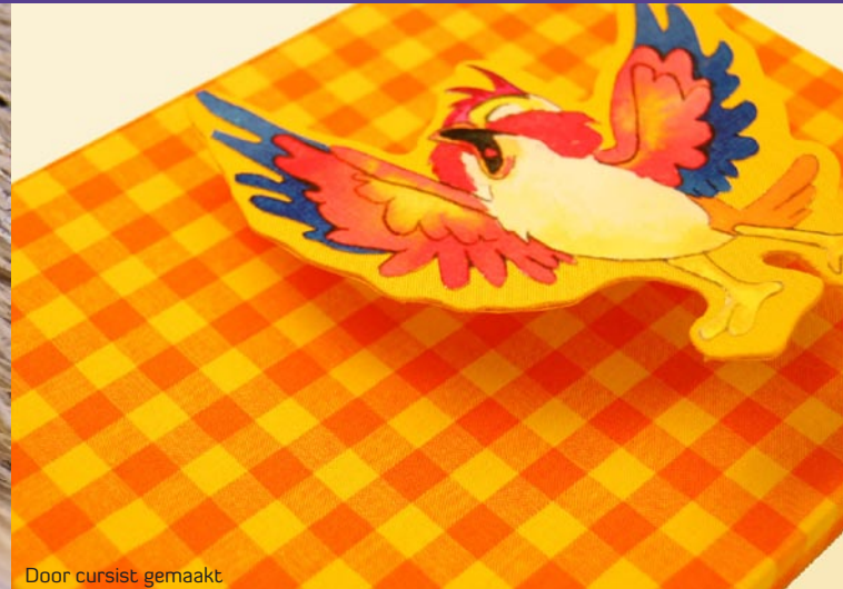
Door cursist gemaakt