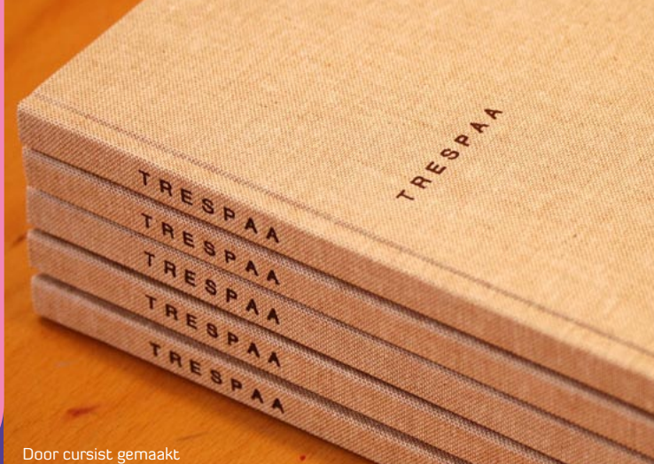
Door cursist gemaakt

Schilderen is ook een vorm van je verhaal vertellen, ik vind het leuk om daarbij technieken en materialen te gebruiken die uit het boekbinden komen.